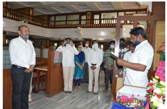
Youth day celebrating in central Library