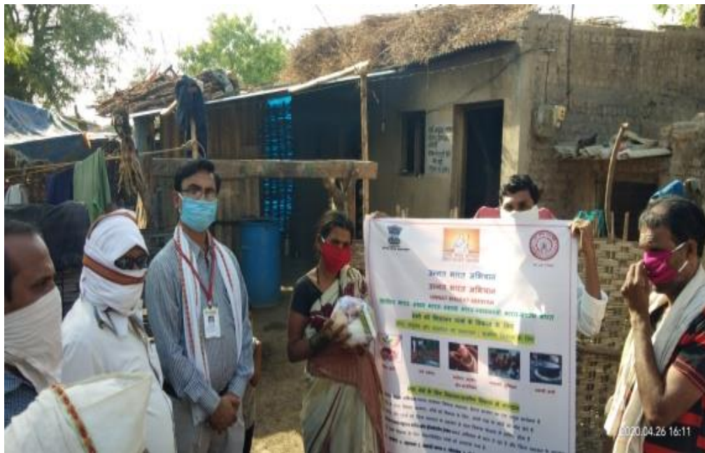
Mask, Sanitizers and Food Distribution