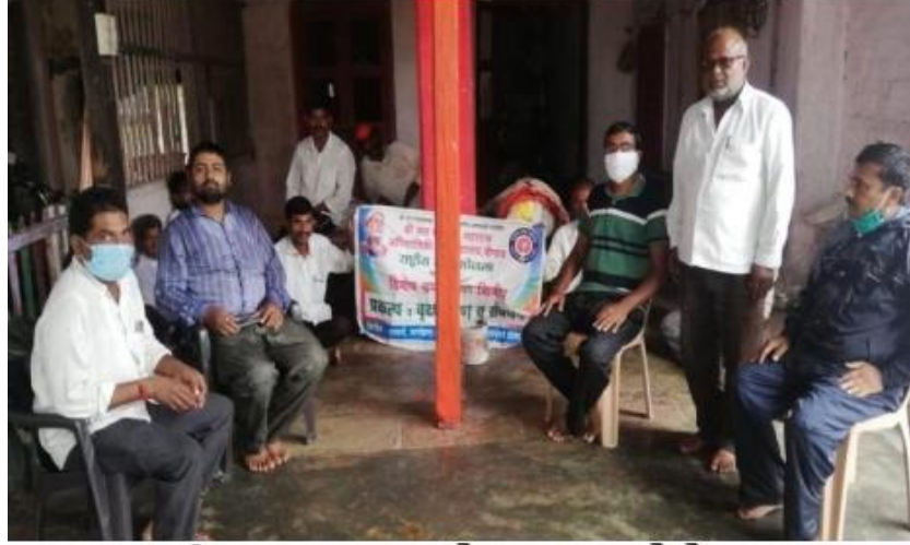
राष्ट्रीय स्वच्छता केंद्र सुरु केले