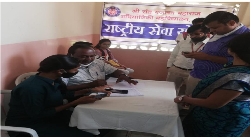
All the Teaching, Non-teaching , students and their family Members participating in Covid 19 Vaccination Camp