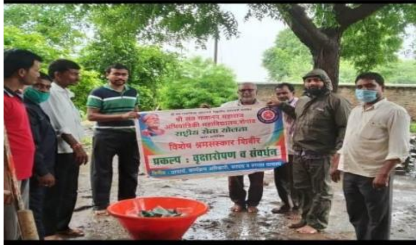
एकल वापर प्लास्टिक संग्रह आणि त्याचे विघटन पध्दती